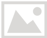
Immagine momentaneamente non disponibile